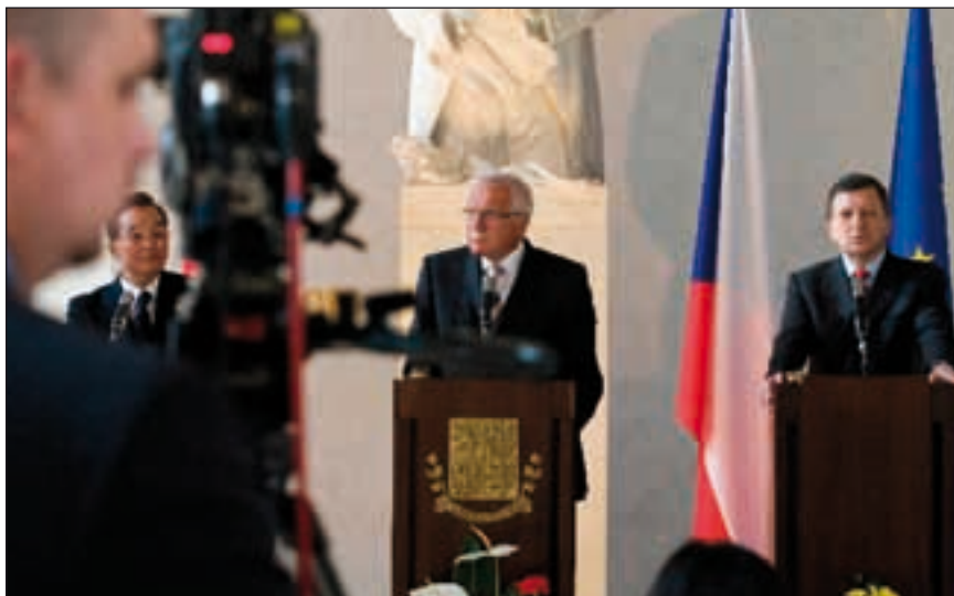
Bild 3: Nicht mehr lange im Abseits – Chinas Rohstoffpolitik wird immer dominierender

In der Folge multiplizieren sich potentiell existenzielle Abhängigkeiten und Bedrohungen geradezu. Wenn neue Produkte in den Markt kommen, gibt es ebenfalls noch eine temporäre Aushebelung des Recyclingansatzes. Denn immer, wenn eine neue Technologie in den Markt eingeführt wird, muss erst der Produktlebenszyklus soweit fortgeschritten sein, dass ein Recyclingmarkt aufgrund von Schrottverfügbarkeit entstehen kann. Die europäische Kommission stellt diesen Sachverhalt im Folgenden des Dokumentes durchaus fest, zollt in ihren Schlussfolgerungen und strategischen Empfehlungen jedoch keinem dieser, teilweise zeitverzögert eintretenden,