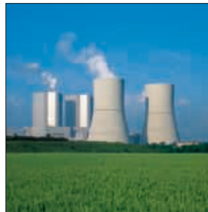
Bild 4: Kraftwerke benötigen in zunehmendem Maße Importkohle

Die Kommission stellt weiterhin fest, dass sich die EU nicht nur überaus schwer damit tut, ihre „hohen moralischen Grundsätze“ zukünftig wahrscheinlich verlassen zu müssen, sondern diese auch zeitgleich als relatives Kulturgut anerkennen zu müssen. Was haben wir denn in der Vergangenheit anderes getan, als ein globales gesellschaftliches, politisches und wirtschaftliches Regelwerk zu schaffen und zu dominieren, welches im Wesentlichen dazu diente, in den letzten 60 Jahren unseren industriegesellschaftlichen Wohlstand zu sichern und zu mehren? Jetzt den aufkommenden konkurrierenden Schwellenländern unfaire Marktverzerrung und Vorteilsnahme vorzuwerfen, weil diese ihre eigenen Mittel und Wege finden und kreieren, ihre eigene Existenz und ihr eigenes wirtschaftliches Überleben abzusichern, mag sich zwar aus europäischer Sicht gut anhören, wird aber im