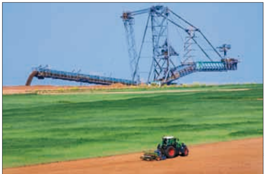
Bild 5: Braunkohle in Europa – aus vielen guten Gründen nicht gesellschaftlich vermittelbar

Wer dieser nationalen Strategie nicht hinreichend hörig ist, bekommt die andere Seite Chinas zu spüren, wie unlängst Australien durch die fadenscheinige Verhaftung des Rio Tinto CEOs in China. Dieser australisch dominierte Großkonzern wagte es, sich dem freundlich vorgeschlagenen chinesischen Preissenkungswünschen für Eisenerz zu widersetzen. Die unmittelbare Konsequenz aus diesem bilateralen, diplomatischen Großereignis waren und sind nicht zuletzt die zahlreichen Schweißperlen auf der Stirn des australischen Premierministers Kevin Rudd, oder die Tatsache, dass die gesamte australische Regierung für mehr als eine Woche abgetaucht war und bis heute noch keine wirkliche Regierungserklärung hierzu abgegeben hat. Vielmehr haben hierdurch sämtliche CEOs sämtlicher Konzerne der Welt gelernt und verstanden, dass sie fortan besser im